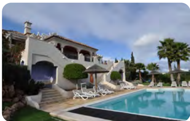
✘ Sans soleil

Ouvrez les rideaux pour laisser entrer la lumière. Même par temps nuageux, la lumière extérieure peut être utile.